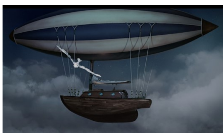
LES BALLONS : DIRIGEABLE ET MONTGOLFÈRE

Nous créerons avec les enfants les personnages et leurs 2 ballons, qui seront mobiles et manipulables.